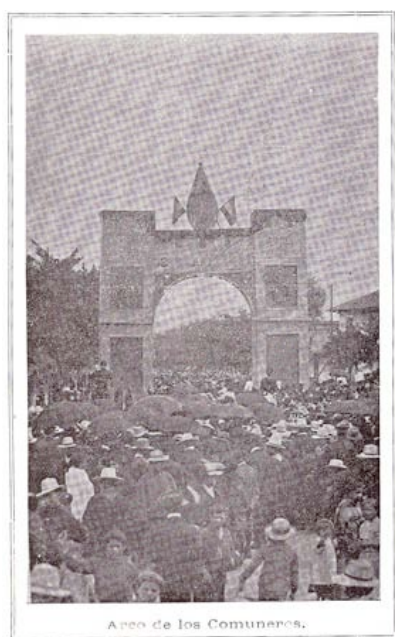
Arco triunfal en memoria del movimiento comunero

Como un gesto de reconocimiento al antecedente inmediato del movimiento de independencia incentivado desde 1810, se erigió en la Avenida Jiménez, hacia las afueras de la ciudad, un arco triunfal construido en materiales perecederos, y que de acuerdo a tradiciones provenientes de festejos virreinales se pensó, al igual que los pabellones del parque de la independencia, como transitorio y efímero desde el momento de su proyección. La localización del arco no era gratuita, justamente señalizaba el lugar de entrada que el movimiento comunero debería seguir en caso de entrar a Santa Fe... la construcción provisional de este acto y el hecho de que este monumento no halla sido de carácter permanente implica que la memoria del movimiento social que sirvió de antecedente agitador para la gesta de independencia quedó sin memoria expresa para el futuro.