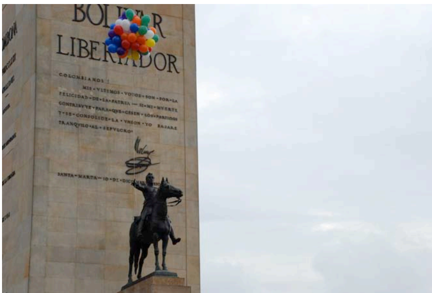
Registros intervención Mestizo Ilustrado (Bolívar de Framier) Calle 80 con Av Caracas