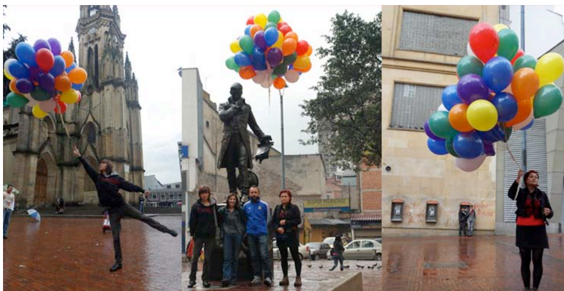
Registros del equipo entorno a intervenciones realizadas en noviembre de 2010

Para el caso de los estudiantes interesados en este proyecto, el trabajo de la asignatura se convirtió en participar y acompañar la orientación de la formulación de este proyecto para su aplicación al premio de creación docente estudiantil e iniciar un proceso de documentación e investigación pertinente para la realización del proyecto.