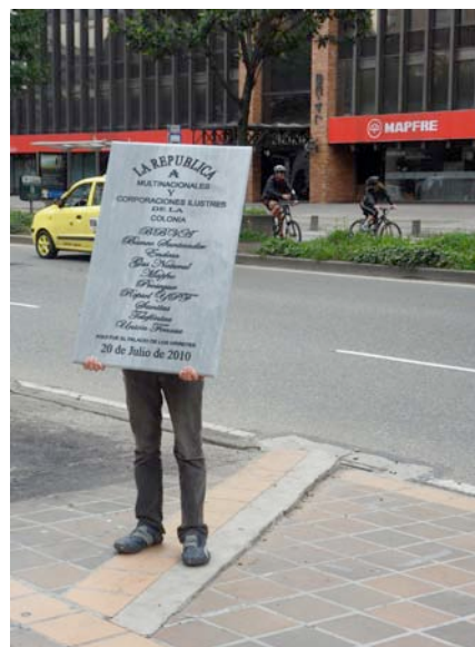
Registros intervención Memoria Colonial