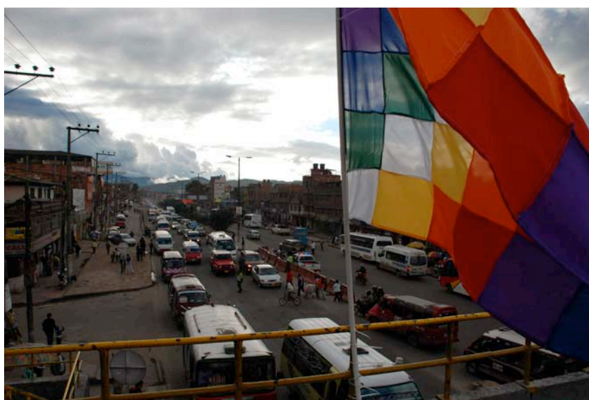
Registros intervención Arco Comunero. Autopista Sur – Soacha Cundinamarca