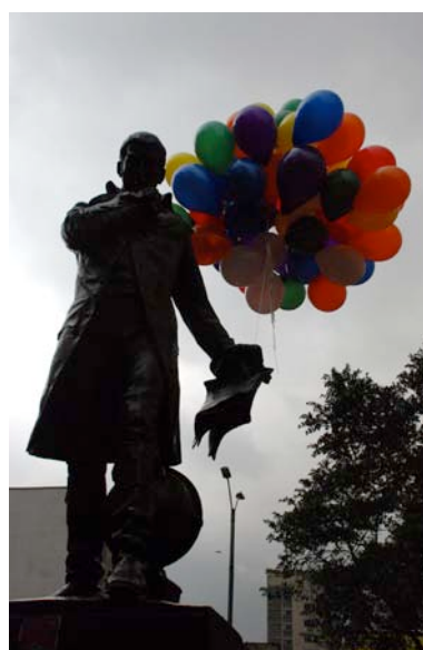
Registros intervención Mestizo Ilustrado (Caldas de Verlet) Plaza de las Nieves