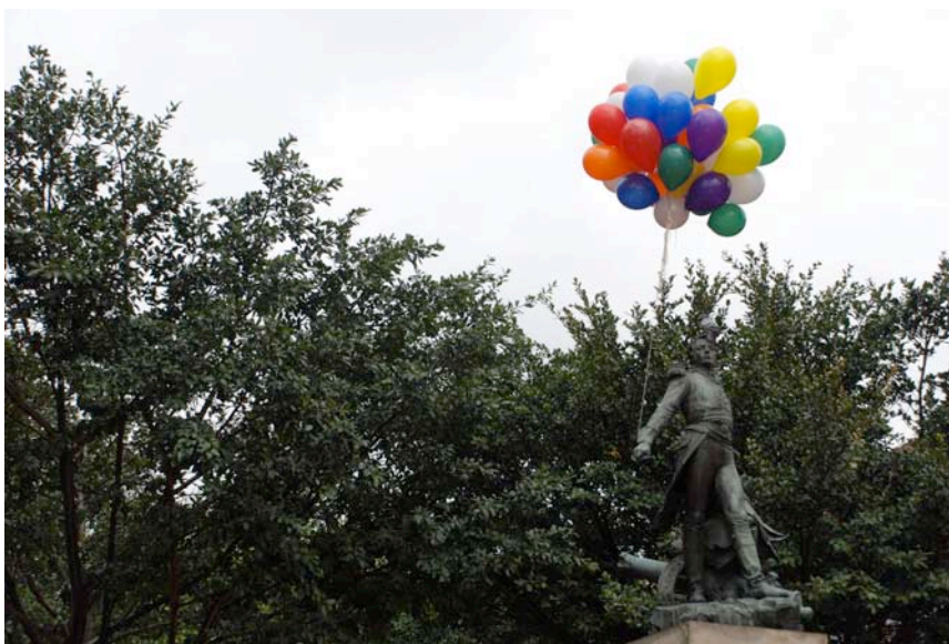
Registros intervención Mestizo Ilustrado (Sucre de Verlet) Parque de Lourdes