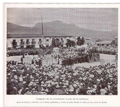
Inauguración de la estatua ecuestre de Bolívar y el monumento a Nariño

La inauguración de estos monumentos correspondió a actos públicos con declamaciones de discursos, coronaciones y ofrendas florales que hicieron parte de todo un dispositivo performático de conmemoración... Y, por otra parte, cada elaboración de estas estatuas implicó un enorme esfuerzo económico para poderlas pagar, de modo que algunas, incluso se inauguraron años después de los festejos como sucedió con la de Antonio Jose de Sucre.